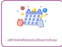
บริการจองห้องอบรม/สัมมนา/ประชุม