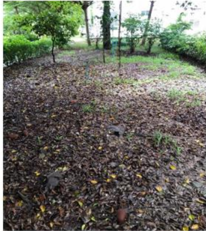
ภาพพื้นที่ จุดที่ 2 บริเวณบันไดทางเดิน ขึ้น-ลง ด้านข้างศาลาริมน้ำ