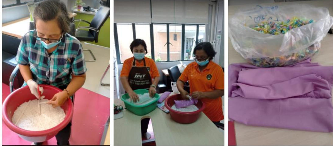
กิจกรรมการทำหมอนจากหลอดน้ำ