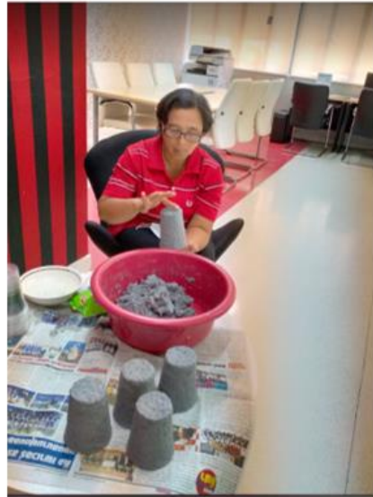
กิจกรรมการทำแก้วเปเปอร์มาเช่จากแก้วพลาสติก