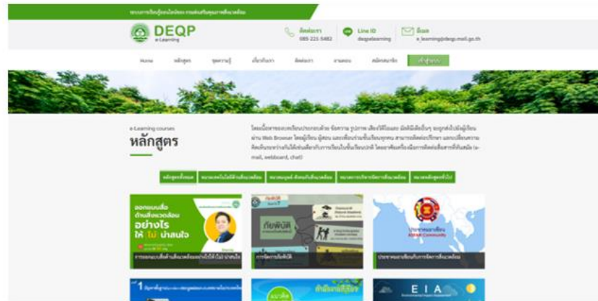
เว็บไซต์สรุปภาพรวมระบบ