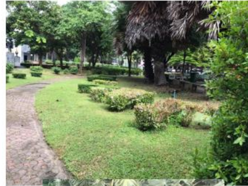
ภาพพื้นที่ จุดที่ 3 บริเวณด้านหน้าสำนักวิทยบริการฯ