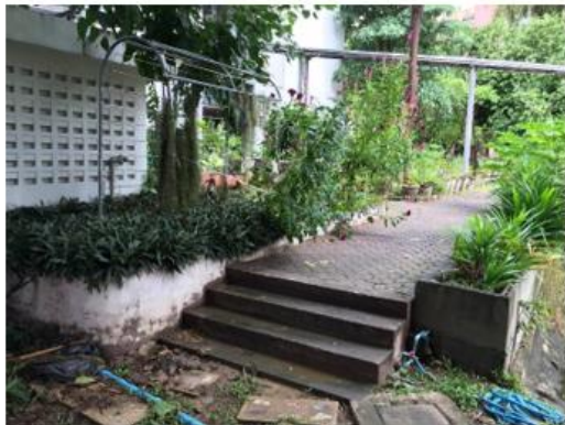
ภาพประกอบการสำรวจภูมิทัศน์ภายนอกสถานกา