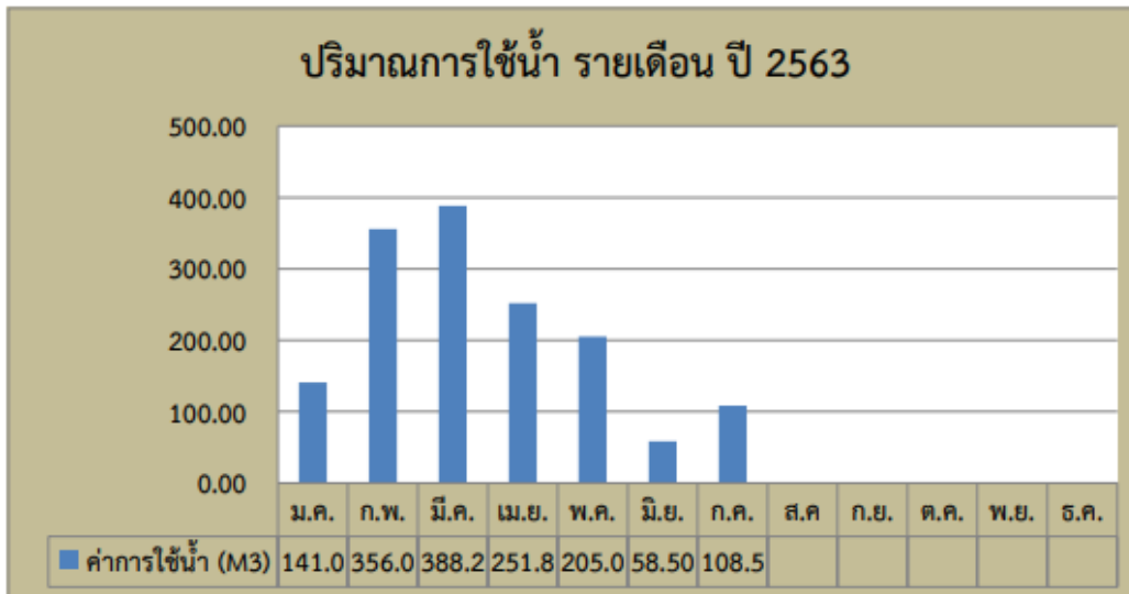
ภาพที่ 4 ปริมาณการใช้น้ำ รายเดือน ปี 2563