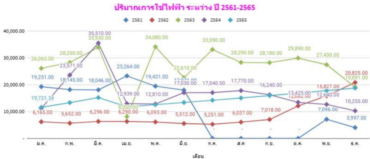
ภาพที่ 5 การเปรียบเทียบปริมาณการใช้ไฟฟ้า ระหว่าง ปี 2561-2565