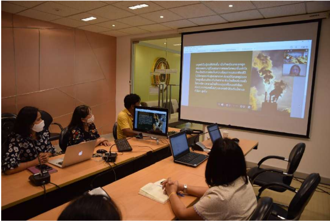
5. การอบรมเรื่อง “การจัดการมลพิษและของเสีย”