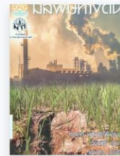
มลพิษทางดิน