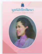
มูลนิธิชัยพัฒนา