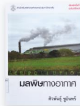
มลพิษทางอากาศ