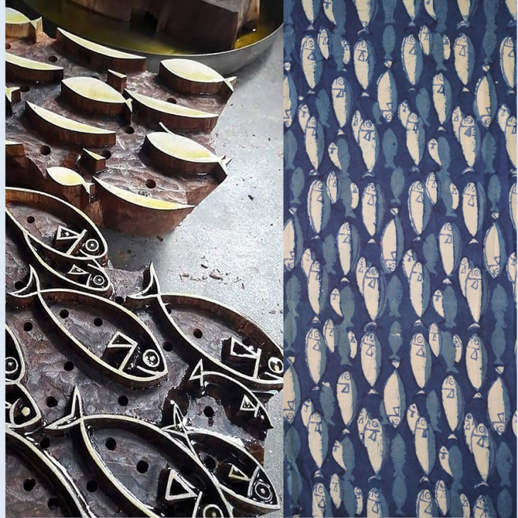
แม่พิมพ์ไม้ลายปลา ที่มา : เส้นทางการค้าโบราณ สีสน มหัทศจรย์ ผ้าพิมพ์ลาย, ๒๕๖๔